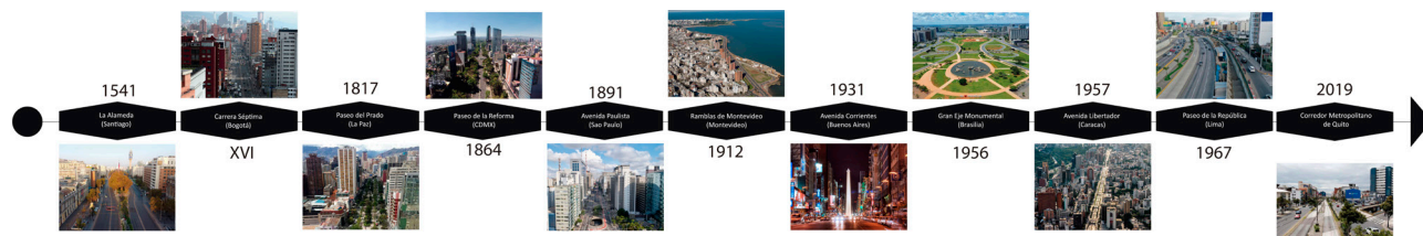
Figura 1. Corredores urbanos de América Latina en el tiempo.

Desde sus orígenes (en su mayoría previos al siglo XIX) fueron vías estratégicas para la movilidad intraurbana que integraban los polos extremos de la ciudad con la centralidad histórica de carácter zonal. Entre ellas están la Alameda O'Higgins en Santiago, Carrera Séptima en Bogotá y Avenida Guayaquil-10 de agosto en Quito. Pero, adicionalmente, se encuentran los que no atravesaban la centralidad urbana, aunque la circunvalaban, como son los casos del Paseo de la Reforma en México 10 , El Prado en La Paz o Avenida Libertador en Caracas. En la Figura 1 se puede observar la línea del tiempo de los corredores desde su fecha de origen.