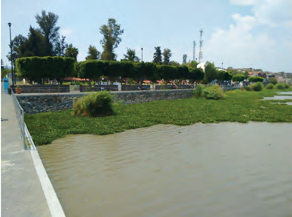
Delirio en la laguna