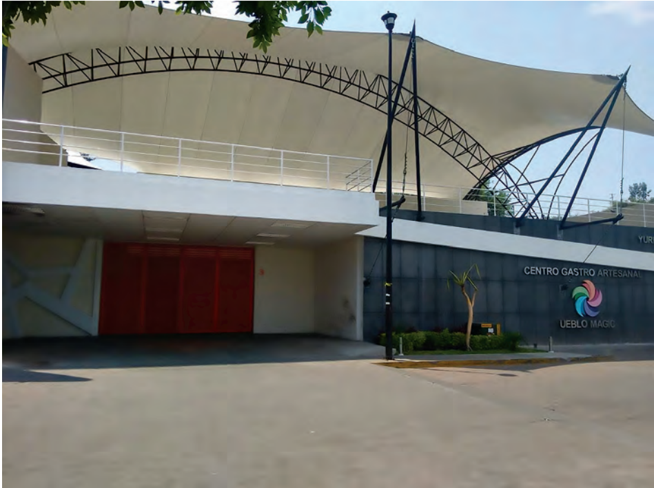
A puerta cerrada