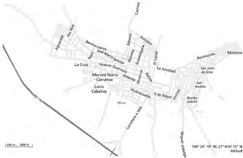
Mapa 2. Estructura urbana de Xala.

de calles y manzanas se conforma por medio del esquema conocido como plato roto, 16 característico de numerosos lugares en México. Esta disposición se dio de manera natural entre los pobladores, quienes fueron expandiendo los límites de acuerdo con sus necesidades de crecimiento sin disponer de algún plan urbano previamente establecido.