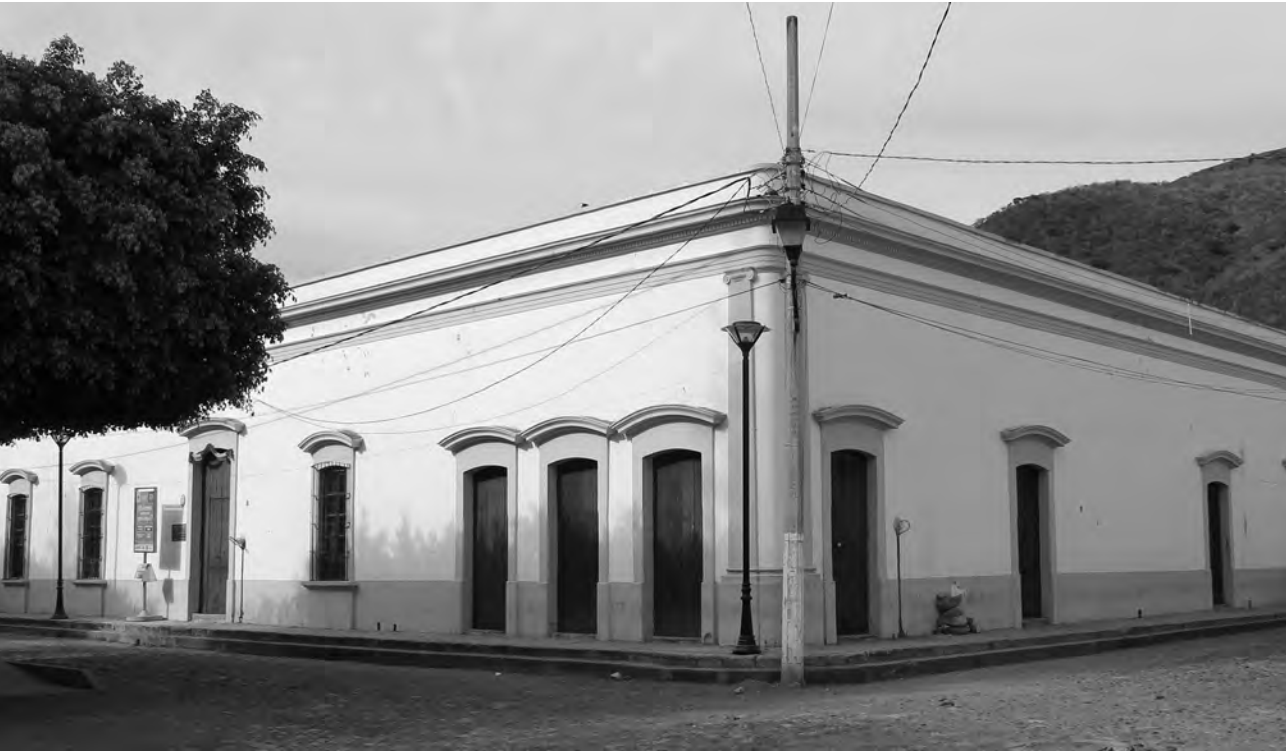
Casa de Cultura