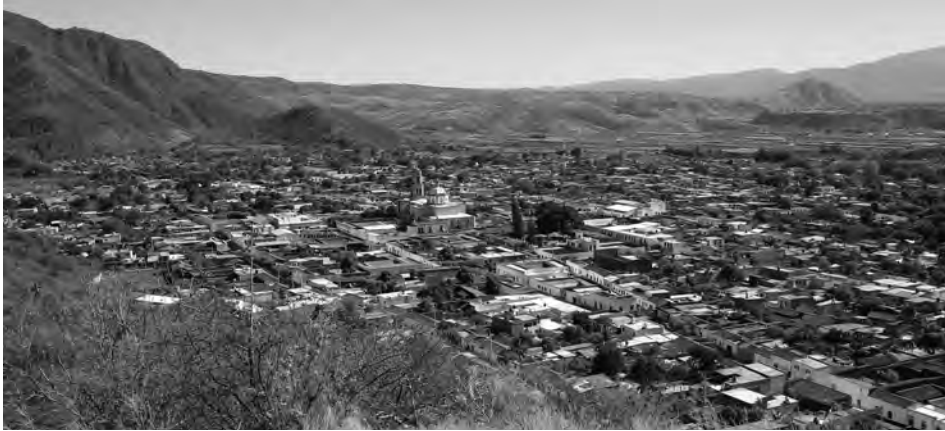
Imagen 2. Vista aérea de Xala.